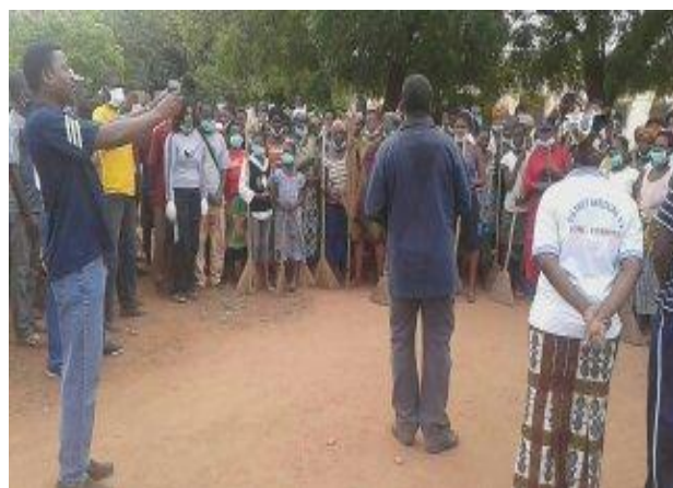
Mot de remerciement de son excellence M. le ministre