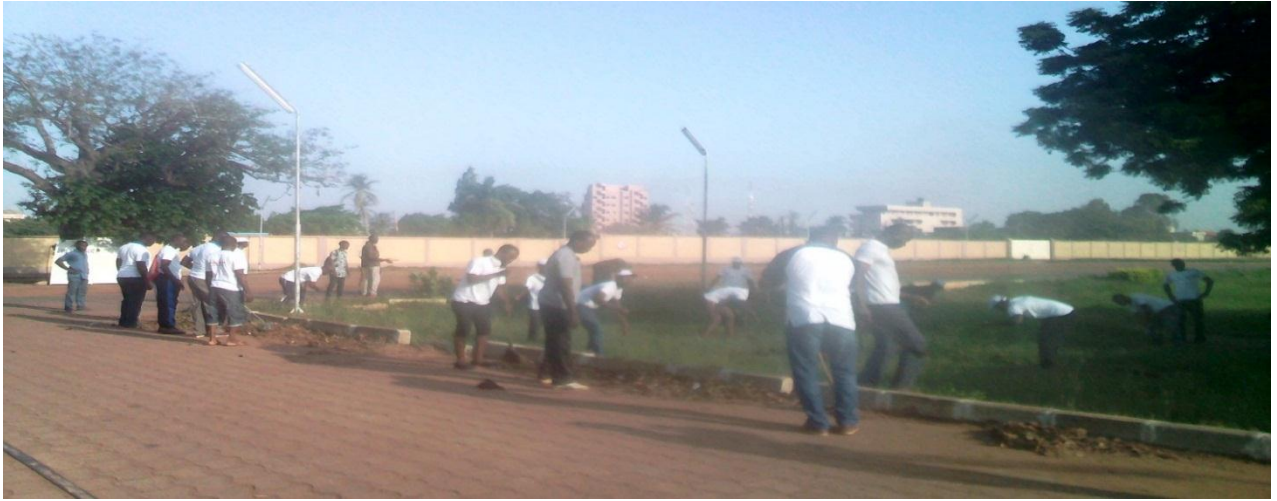
Sarclage, balayage du site