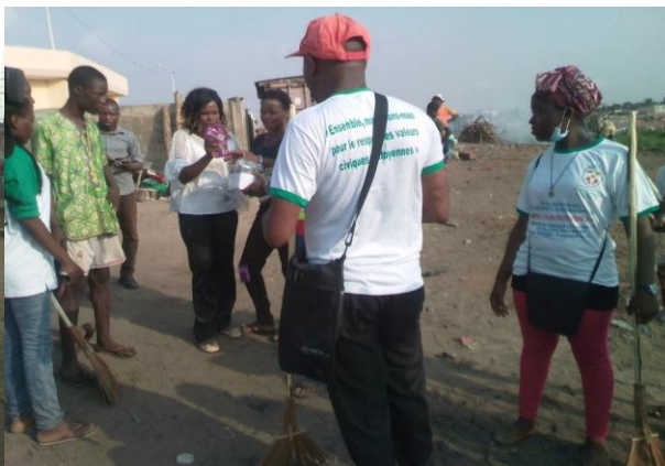
AVIP-TOGO en pleine sensibilisation