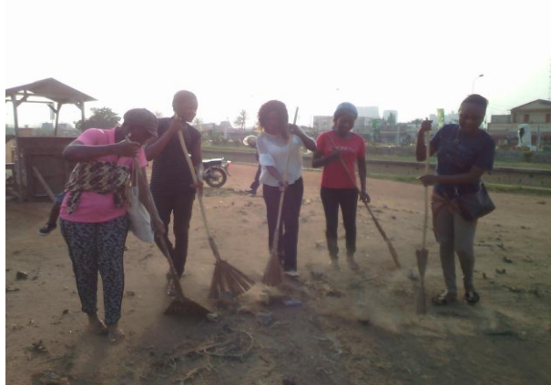
La directrice d'AVIP-TOGO au milieu

A la même occasion, l'association AVIP-TOGO a fait une sensibilisation au cours de laquelle elle a distribué des préservatifs féminins et masculins à tous les participants et les a exhortés à adopter des comportements responsables.