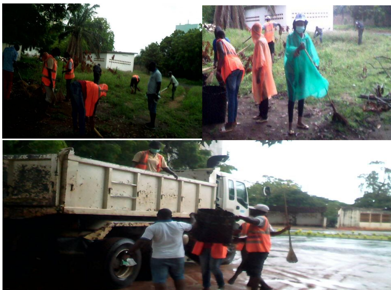
Enlevement des ordures par les agents d'entretien d'ANASAP

Le samedi 03 Juin 2017, AVIP-TOGO, ANASAP et bien d'autres associations de la place se sont organisés pour venir en appui au personnel de la RADIO LOME qui ont voulu mettre au propre leur structure. Notre arrivé sur le site malgré la pluie déjà à 6h 45 min a dissipé dans l'esprit de ceux qui y étaient déjà, le découragement, à cause du mauvais temps. Ainsi avec courage et détermination de la Directrice d'AVIP, nous avons commencé le travail par le sarclage des mauvaises herbes à côté du jardin et dans l'enceinte, au balayage du site. Les tas d'ordures qui rendaient vilain le lieu ont été enlevés grâce à un chariot pour le ramassage d'ordure qu'ANASAP a mis à notre disposition. Il faut noter que cette manifestation a vu une forte mobilisation de 50 personnes dont la plupart sont des jeunes. L'activité a pris fin au environ de 09h30 min.