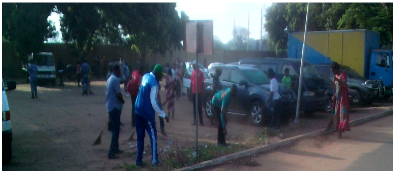
Le personnel de la DTRF met la main à la pâte

A la même occasion, l'appui d'ANASAP a constitué à ramasser automatiquement les tas d'ordures et les arbres coupés. L'activité de ce jour a pris fin à 8h30 aux environs.