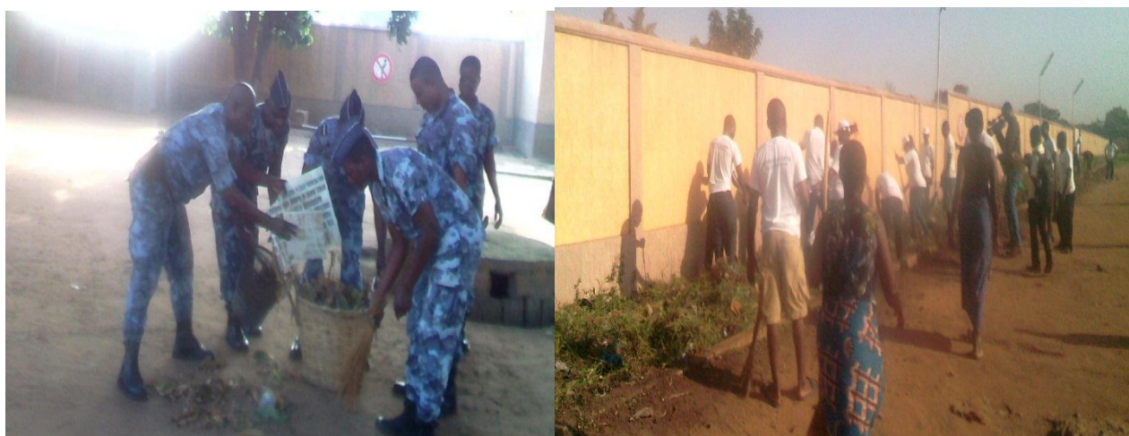
La police du site et le quelques personnels de SOTOPLA à l'œuvre