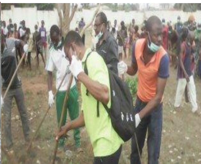
Monsieur le ministre en chemise noire et en verre