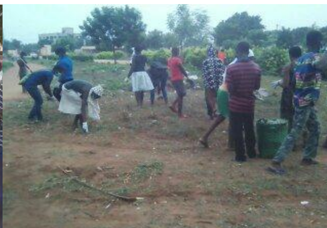
Ramassage des sachets plastiques