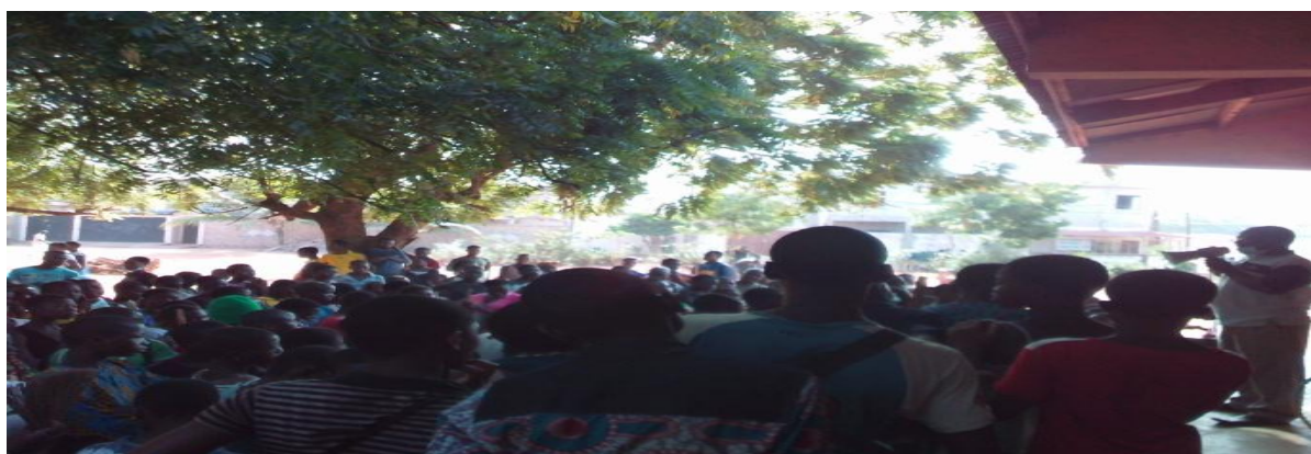
Vue d'en gros des participants présents

Le partage de préservatifs à tous les participants adultes avec partage des sachets de pure water par AVIP-TOGO a égayé l'assistance et une sensibilisation sur les valeurs civiques par le représentant de la direction de la formation civique M. Tchandao. Les mots de remerciements de madame la directrice d'AVIP-TOGO Mme AKPOTO et celui du directeur dudit CEG ont marqué la fin de l'opération aux alentours de 08h30 minutes.